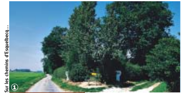
Sur les chemins d'Esquelbecq...

Bocage Flamand et marais Audomarois, au fil de l'Yser