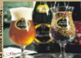
La Blonde d'Esquelbecq*.

pays. Elle n'a pas mauvais genre, bien au contraire. Elle est généreuse, très nature, élevée dans la plus pure tradition flamande. Elle est née en 1996 de la volonté de Daniel Thiriez d'installer à Esquelbecq une microbrasserie artisanale. En 1997, il met sur le marché la Blonde d'Esquelbecq*, une bière non filtrée, non pasteurisée, qu'il décline ensuite en ambrée, blanche et bière de Noël, cette dernière plus douce et plus fruitée. A l'origine, en 1855, fut construite une ferme-brasserie à l'emplacement d'une briqueterie. Vers 1930, Monsieur Poidevin en devient propriétaire jusqu'à la cessation d'activités en 1945 ; la brasserie est alors convertie en dépôt